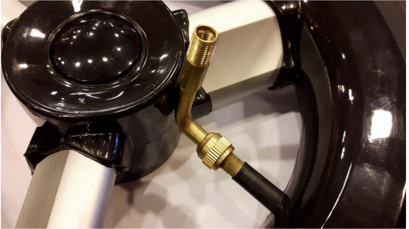
nakręcona przedłużka 90 stopni na prosty wentyl w kółku, dokręcony wężyk od pompki