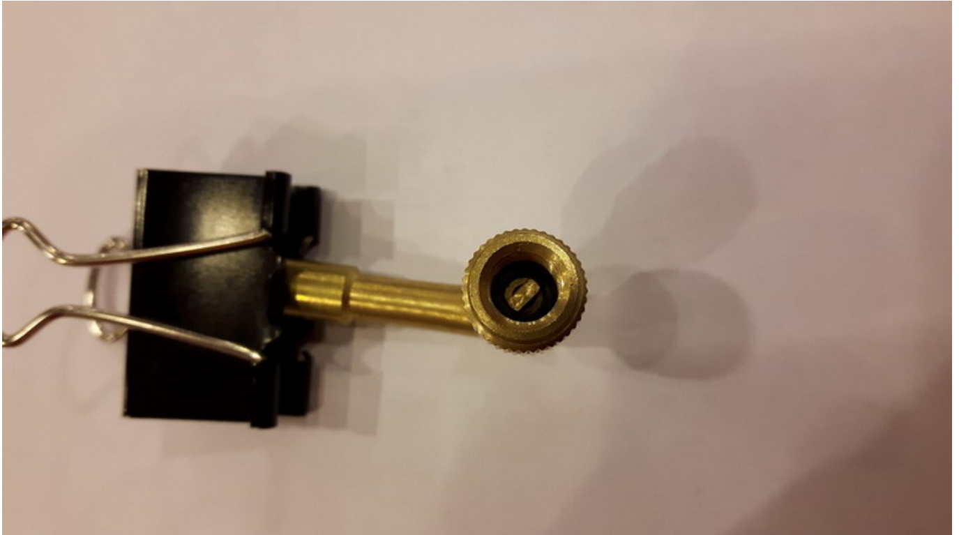
wygląd przedłużki 125 stopni