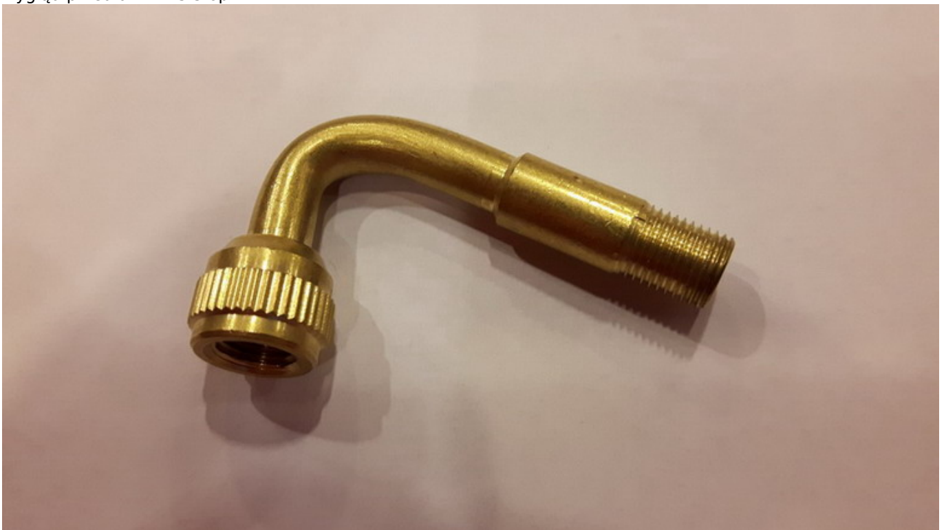
nakręcona przedłużka 90 stopni na prosty wentyl w kółku