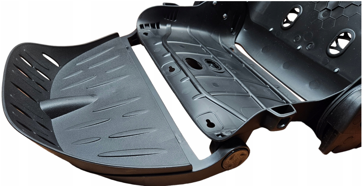
Widok tyłu oparcia