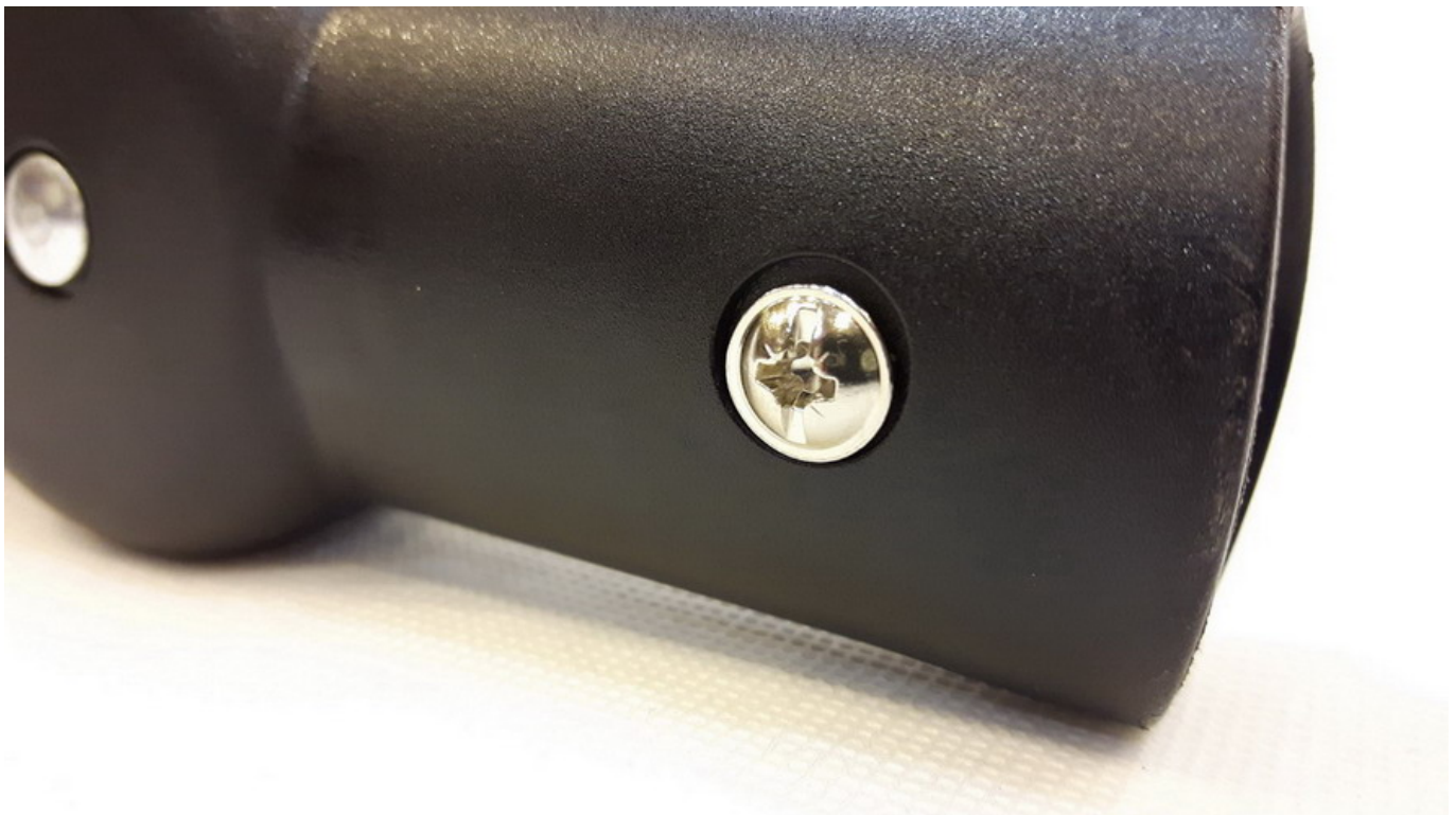
Naprawa regulacji rączki