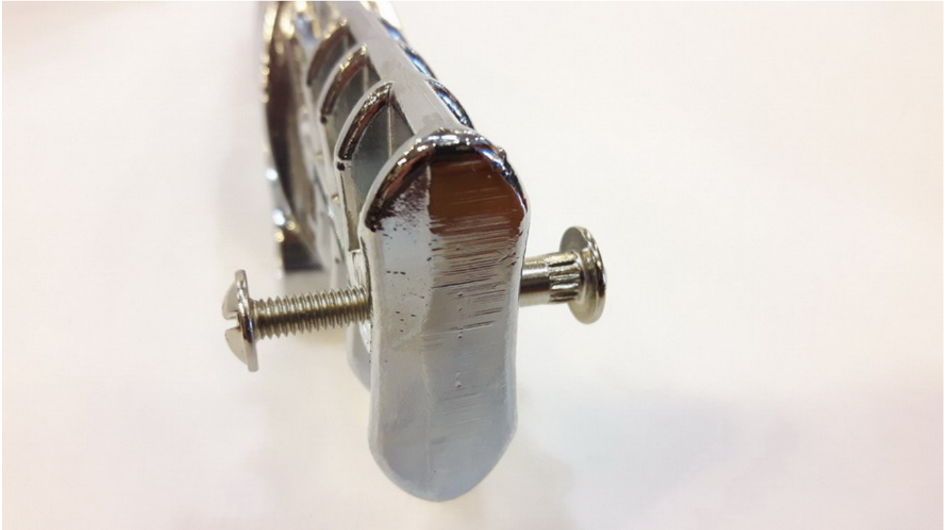
Mocowanie zawiasu stelaża