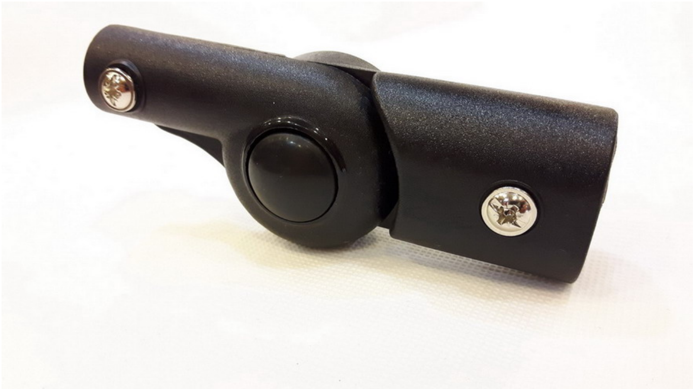
Montaż regulacji podnóżka